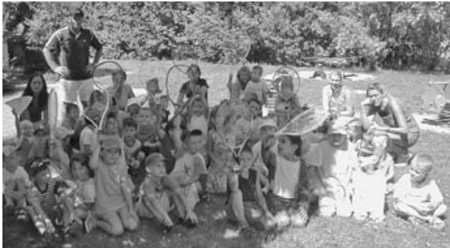
Der Nachwuchs für den Nachwuchs kommt aus dem Kindergarten Spatzennest

Aber auch um den Nachwuchs für den Nachwuchs ist der TCG besorgt: Jeweils am Freitagmorgen bekommen die Kinder des Kindergarten Spatzennest die Gelegen-