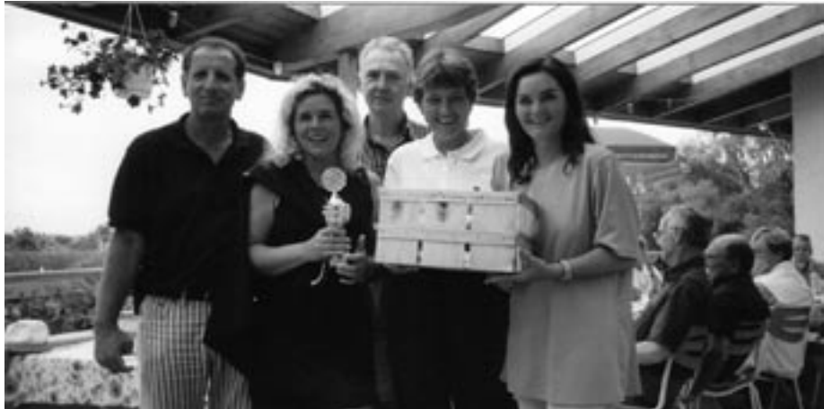
Dieses Damenteam „erntet“ Pokal und Spargel