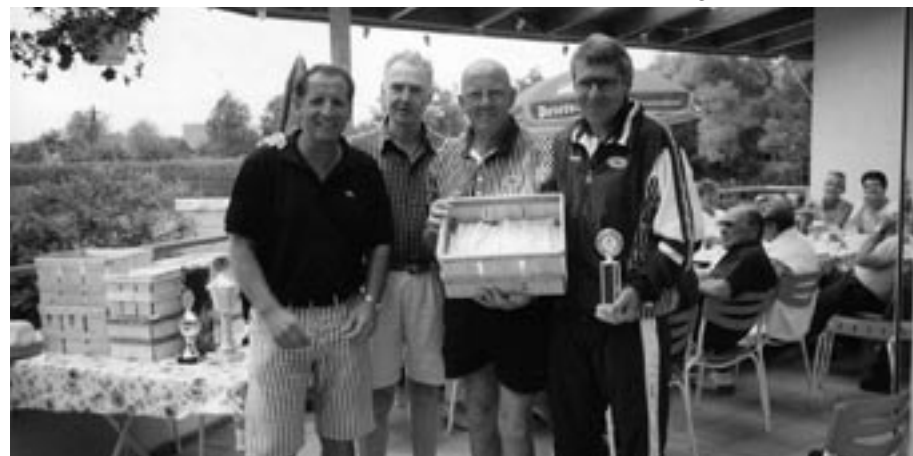
Das Team aus Willstätt freut sich über den Spargel