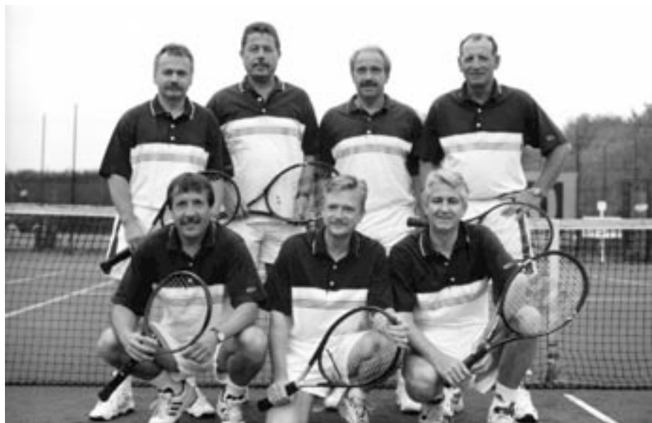
Herren 40 Meister 2. Bezirksklasse 2002

Herren-Einzel Junioren-Einzel Juniorinnen