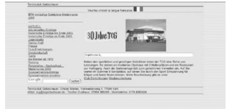
Die TCG-Homepage (Startseite)