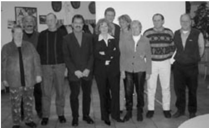
Vorstandschaft 2003/2004 - hier einfügen

Daran sollten wir alle denken, wenn da und dort Unzulänglichkeiten auftauchen, Fehler gemacht werden und manches eben nicht ganz so richtig läuft. Denn bei aller sportlichen Ernsthaftigkeit: „Tennis ist die herrlichste Nebensache der Welt!“