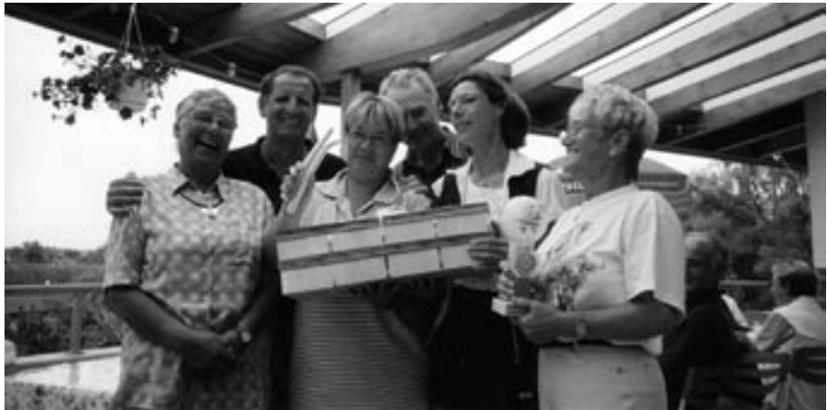
Das „Meerrettich-Team“ aus Urloffen schätzt auch Spargel