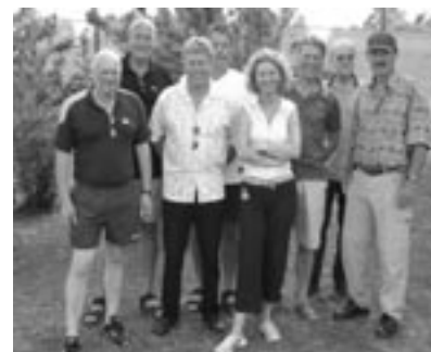
Herren 50 Meister 2. Bezirksklasse 2003