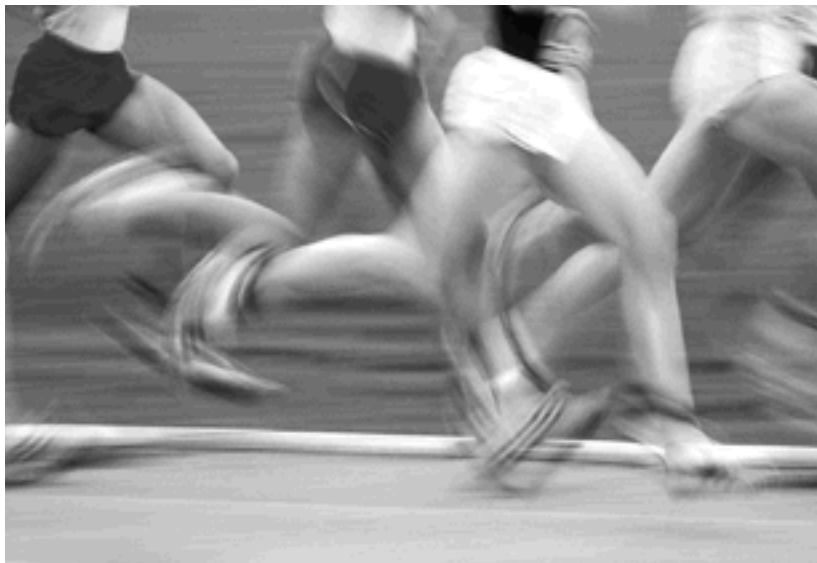
KALISCH & PARTNER, Offenburg

Wer mit seiner Energie haushaltet, läuft der Konkurrenz davon. In dieser Disziplin sind die Badischen Stahlwerke vorn dabei. Der Energieverbrauch wurde in den vergangenen Jahren kontinuierlich gesenkt. Dank modernster Technologie. Dabei bleibt auch die Umwelt nicht auf der Strecke. BSW produziert den Stahl ausschließlich aus Schrott. Sogar die Nebenprodukte werden weiterverarbeitet. So schont BSW natürliche Ressourcen und vermeidet Abfälle.