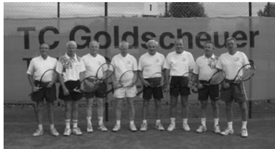
Herren 60 Meister 2. Bezirksliga 2002

Wenn die Freude am Spiel, an der Bewegung und die Begegnung mit Gegner und Partner sowie das Fairplay im Vordergrund steht, dann bereitet das Tennisspiel unabhängig vom erreichten Tabellenstand Freude und Spass.