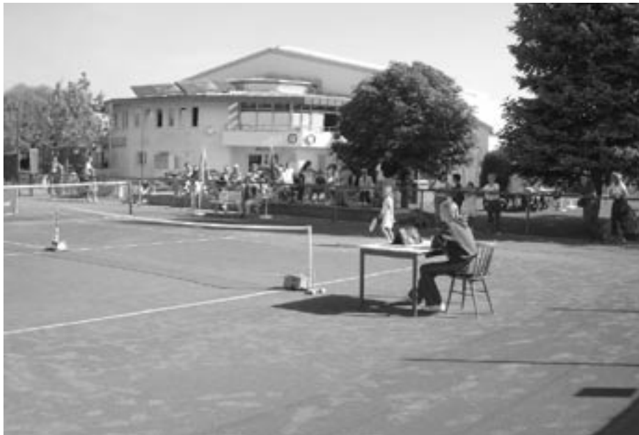
Blick auf Freiplätze