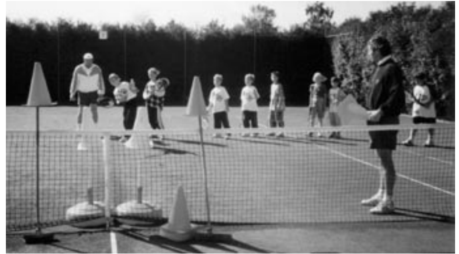
Die Minis bei der Trainingsarbeit