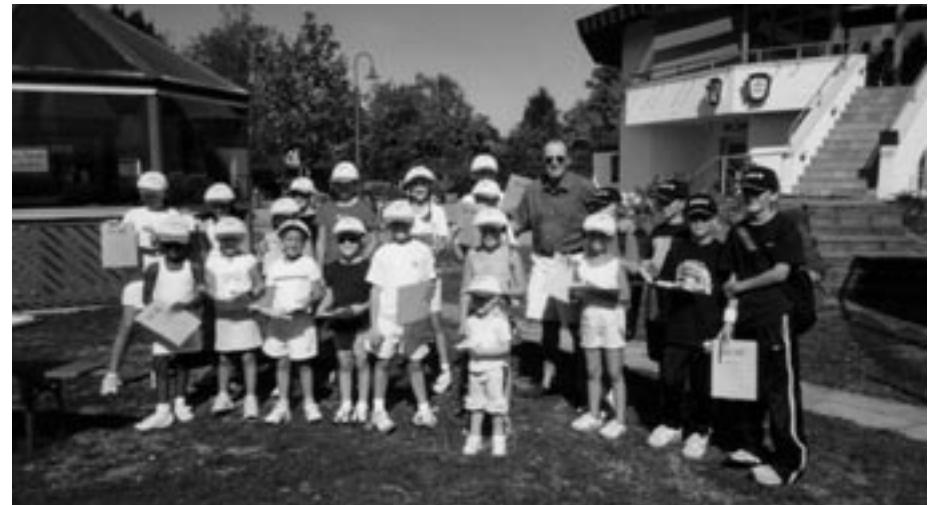
Die Minis bei der Trainingsarbeit

Und mit Beginn der neuen Saison wird die geplante Kooperation „Schule-Tennisclub“ in die Realität umgesetzt. In Zusammenarbeit mit der Grund- und Hauptschule Goldscheuer werden die Schüler in regelmäßigen Trainingseinheiten in die technischen und taktischen Grundlagen des Tennisspiels eingeführt.