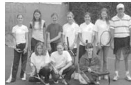
Juniorinnen U16 Meister 1. Kreisliga 2003